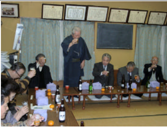
賀詞交歓会の風景