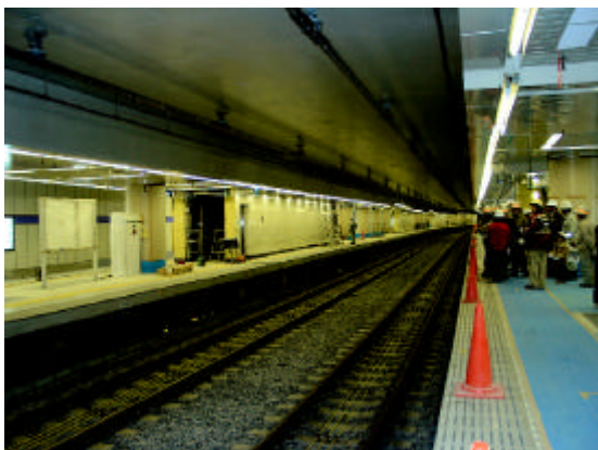
営団押上駅構内の見学

なお、近隣六商店街では、各店頭で『押上・業平界限マップ』を配付し商店街のお買い物物のご案内をします。三月二十一日より三日間、「一店一品運動」の特価セール