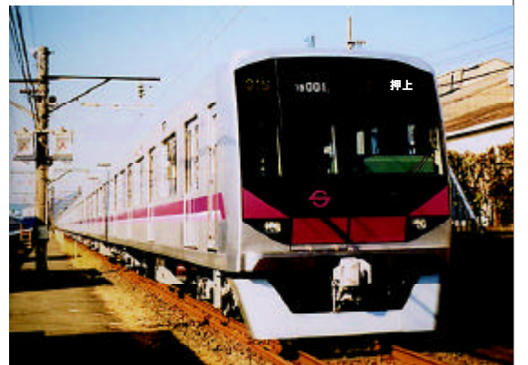
営団地下鉄半蔵門線

昨年五月に、墨田区地域振興部文化振興課より、押上駅開通がいよいよ来春に近づき、この開通を地域の活性化につなげるべく祝賀行事についての説明会が開催され、