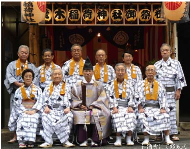
神酒所にて修祓式

町会の皆様におかれましては、この平成二十二年飛木稲荷神社大祭にあたり町内の皆様方にはご奉納、ご協力を賜り誠に有り難うございました。お陰様にて四年に一度の祭典を盛大に楽しく執り行うことが出来ました事をここに厚く御礼申し上げます。