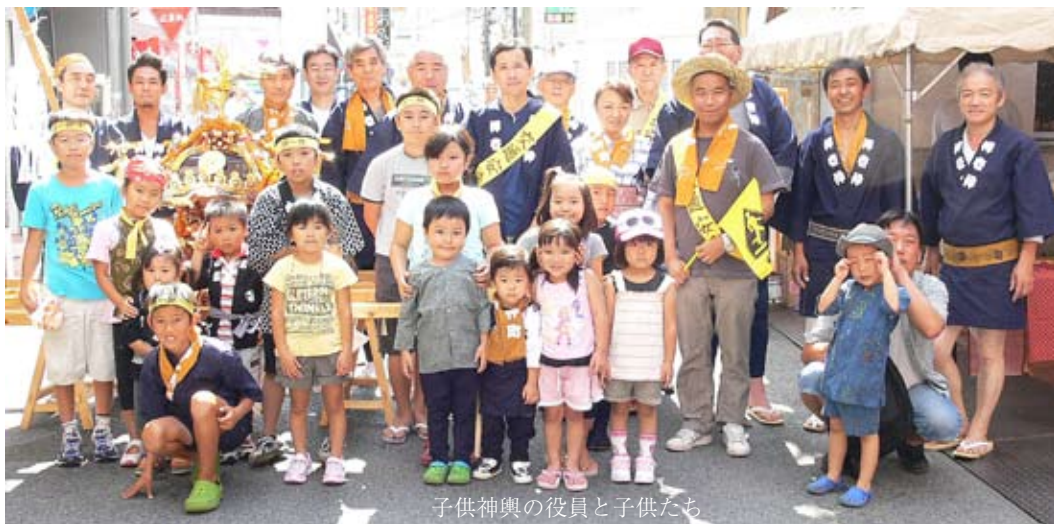
子供神輿の役員と子供たち

児童数四名でむかえた大祭でしたが、皆様にご協力をいただき無事終える事が出来ました。子供会および近隣における少子化の影響を心配致しましたが、山車には大勢の幼児、保護者の方々に集まっていたいただき、子供神輿では元気な小学生の皆さんが頑張ってくれました。祭礼踊りではマイムマイムの曲に合わせて、子供達は大いに盛り上がっていました。模擬店では、今年も婦人会の皆様にご多大なるご協力をいただきました。また卒業生のお母さんにも手伝いいただきました。景品は、各年齢向