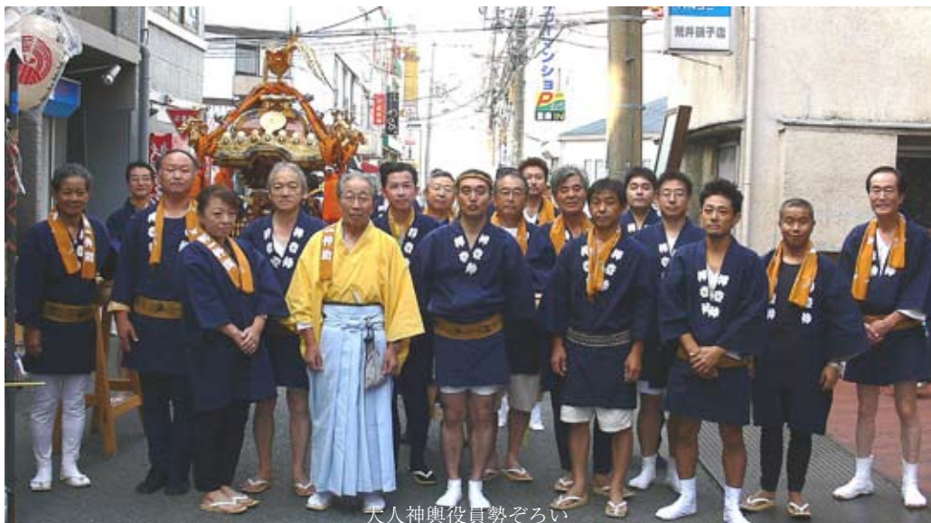
大人神輿役員勢ぞろい