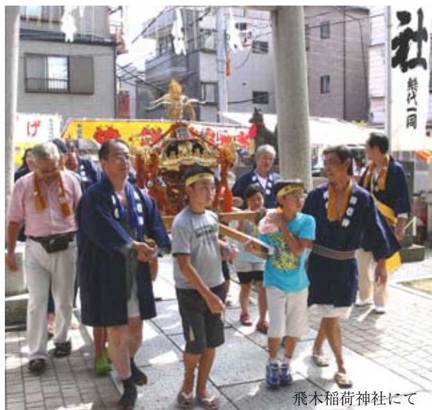
飛木稲荷神社にて

九月十三日映画「歓喜の歌」を曳舟文化センターに見に行きました。楽しく明るい内容でした。九月の飛木神社の大祭にはOSTより数名お手伝いしました。九月二十日はクリーンキャンペーン。町内をお掃除しました。これからも歳なりに頑張ります。よろしくお願ひ致します。